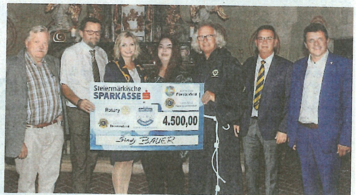
Die fünf Clubpräsidenten übergaben den Spendenscheck